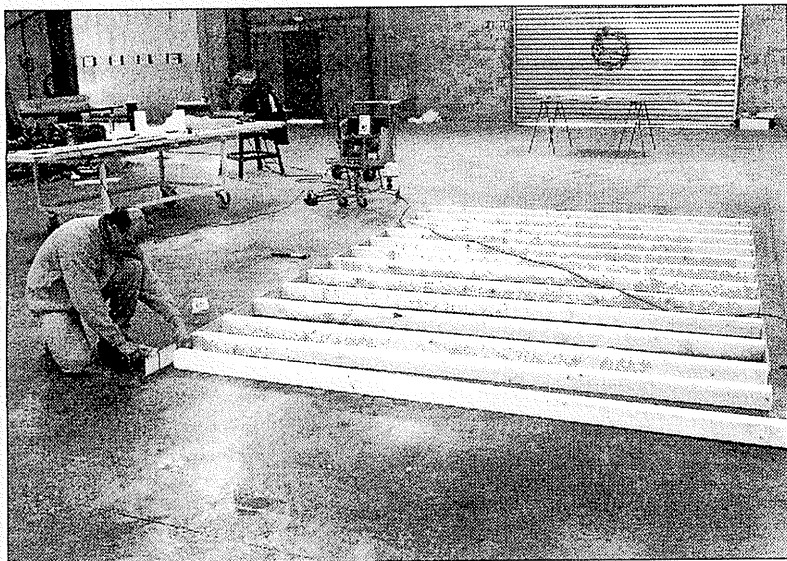
Le bois est omniprésent dans ce produit éco-conçu y compris dans la réalisation du châssis.